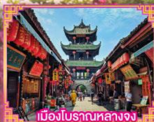
เมืองโบราณหลางจง