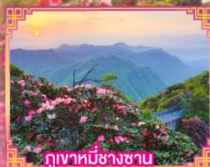
ภูเขาหมีช้างซาน