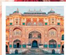
♥♥ Amber Fort