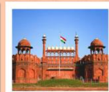
♥♥ Agra Fort