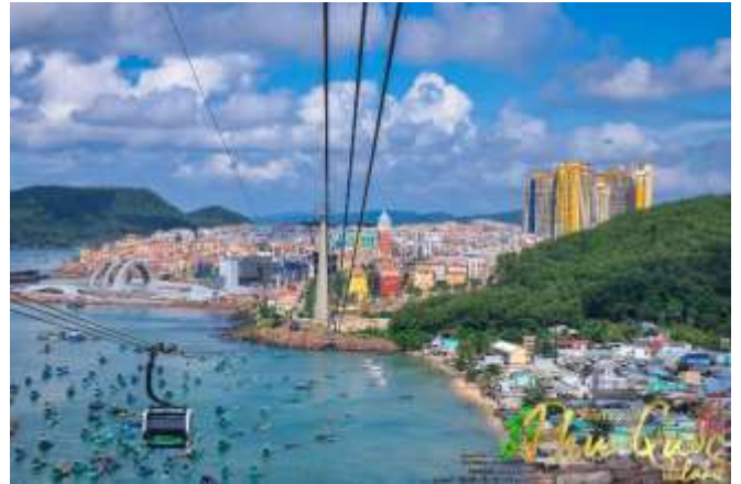
Sun World Hon Thom Nature Park พบกับ

เดียวของเวียดนาม (สำหรับท่านที่สนใจเล่นสวนน้ำ กรุณาเตรียมชุดสำหรับเล่นน้ำ 1 ชุด)