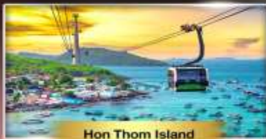
Hon Thom Island