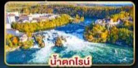
น้ำตกไรน์

✈️ มินิ Full Service เข้าชิวริค ออกมิวนิก