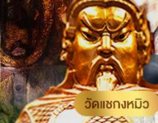
วัดแซกงหมิว