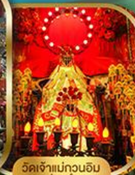
วัดเจ้าแม่กวนอิม ฮ่องฮ่า