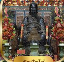
วัดปึกใต้