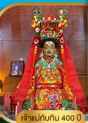
เจ้าแม่กวนอิม 400 ปี Yuen Long