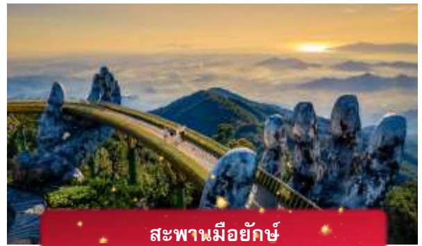
สะพานมียักษ์

นำท่านชม สะพานมียักษ์ แหล่งท่องเที่ยวใหม่ล่าสุดซึ่งอยู่บนเขาบานาฮิลล์ เป็นสะพานสีทองทอดยาวโดยมีมือ 2 ข้างอุ้มไว้ ตั้งอยู่ในตำแหน่งที่โดดเด่นเห็นชัด สวยงาม นำท่านชม สวนดอกไม้แห่งความรัก เป็นสวนดอกไม้สไตล์ฝรั่งเศส ที่มีดอกไม้หลากหลายพันธุ์ถูกจัดเป็นสัดส่วนอย่างสวยงามท่ามกลางอากาศที่แสนเย็นสบาย นำท่านชม สักการะพระพุทธรูปหินอึ้ง เป็นพระพุทธรูปหินองค์ใหญ่ตั้งตระหง่านบนยอดเขาแห่งนี้ ให้ท่านได้ขอพรเพื่อความเป็นมงคล นำท่านชม ป๊อปมาร์ท เป็นร้านค้าของเล่นเปิดใหม่ล่าสุดที่อยู่บนยอดเขาบานาฮิลล์ มีสินค้าของเล่นสำหรับนักจุ่มมากมายให้ท่านได้เลือกชมกับตัวละครน่ารัก อาทิเช่น Molly, SkullPanda, Labubu หมายเหตุ: การจัดการ และข้อกำหนดในการเข้าชมสินค้าอยู่นอกเหนือการจัดการของบริษัททัวร์