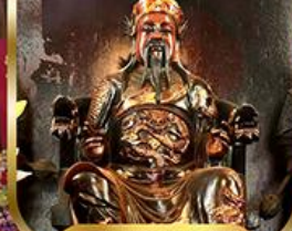
วัดบิกโต ฮองฮำ