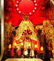
วัดเจ้าแม่กวนอิม ฮองฮำ