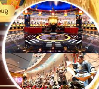
ห้องลับ วัดหวังต้าเซียน

ทริเนอรี่ พิกัดแหล่ง Shopping Tsim Sha Tsui, Mong Kok, Jordan