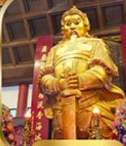
วัดเซ่งหวี