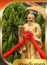
เทพจันทร

พิเศษฟรี! ลงห้องลับหวังต้าเซียน รวมกระเช้าฮ่องกง