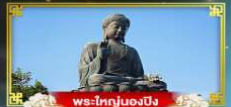
พระใหญ่ของปิง