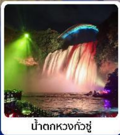
น้ำตกหวงกั๋วซู่