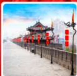
กำแพงเมืองโบราณซีอาน