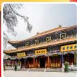
วัดต้าซิงซาน

• โลกที่เกี่ยวข้องชมรดกโลก สุสานกองทัพทหารจีนซีอานได้ ถ่ายภาพความยิ่งใหญ่ของเจดีย์ห้าชั้นปาใหญ่