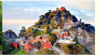
อุทยานเขาบู๊ต้ง

*ทางบริษัทฯ ขอสงวนสิทธิ์ในการสลับโปรแกรมทัวร์ตามความเหมาะสมขึ้นอยู่กับสถานการณ์หน้างาน โดยคำนึงถึงผลประโยชน์ของลูกค้าเป็นสำคัญ