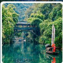
หมู่บ้านชาเมี่ยหมื่นเจีย