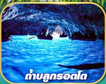
ถ้ำบลูกรอตโต