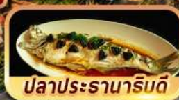
ปลาประรานาภิรมดี