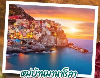
หมู่บ้านมาทริคา