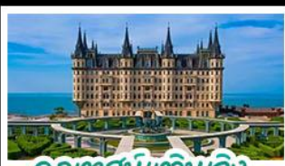
คฤหาสน์เหวินเฉิง

เมืองเก่าชิงเต่า - คฤหาสน์เหวินเฉิง เบียร์ชิงเต่า + อาหารทะเล สตรีทอาร์ต สตูดิโอจิบลิ