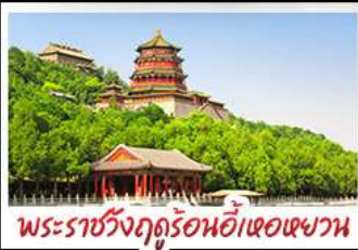
พระราชวังฤดูร้อนอ้าเฮอเฉาหวาน

ท่าแพงเมืองจินตาม๋านจวิ๋งกวน - พระราชวังฤดูร้อนอ้าหอยวน สวนจิ้งอัน - วัดลามะ - โม่งร้านซ้อป - โรงแรม 4 ดาว มือพิศข เปิดปีกกั๊ง สุกั๋มอังกโท MICHELIN GUIDE ร้าน TAO TAO JU