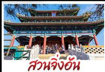
สวนจิ้งอัน