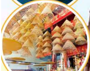
ไหว้พระวัดดัง