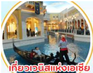
เที่ยวเวนิสแห่งเอเชีย