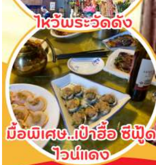
มือพิเศษ...เป่าอ้อ ซีฟูด ไวน์แดง