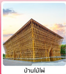
บ้านไม้ไผ่

ไอโกล์ เที่ยวครบ สวนน้ำ Aquatopia & สวนสนุก Vin Wonder เวนิสแห่งเวียดนาม Grand World Phu Quoc แลนด์มาร์คสุดโรแมนติก