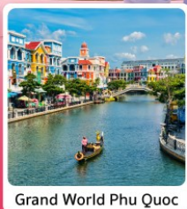
Grand World Phu Quoc