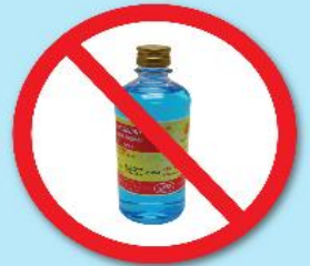
ขวดแอลกอฮอล์