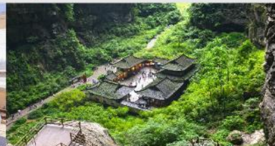
อุทยานแห่งชาติบ่อหลุมฟ้า

*ทางบริษัทฯ ขอสงวนสิทธิ์ในการสลับโปรแกรมทัวร์ตามความเหมาะสมขึ้นอยู่กับสถานการณ์หน้างาน โดยคำนึงถึงผลประโยชน์ของลูกค้าเป็นสำคัญ