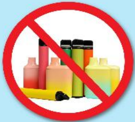
ปืนไฟฟ้า บุหรี่ยุโรป