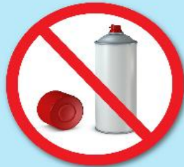
กระป๋องสเปรย์