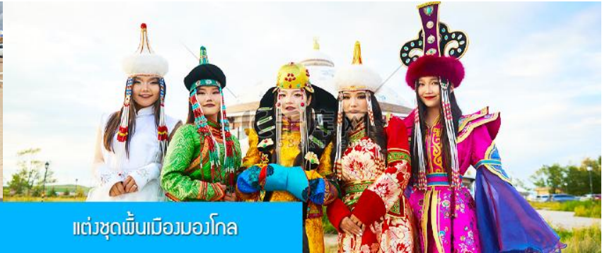
แต่งชุดพื้นเมืองมองโกล