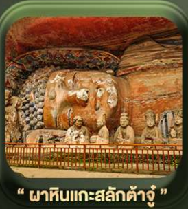
“ พาหินแกะสลักต้าจู้ ”