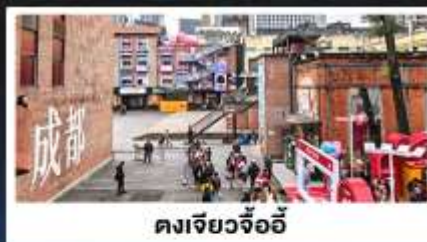
ตงเจียวจ้ออี้