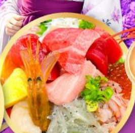
ตลาดปลาชิบิสึ คาชิโนะอิจิ