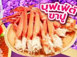
บุฟเฟ่ต์ ชาบู