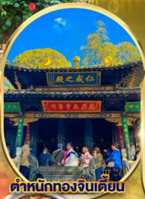
ตำหนักทองจินเตียน