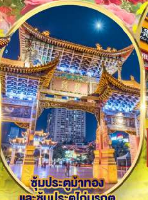
ซุ้มประตูม้าทอง และ ซุ้มประตูไถ่บรกด