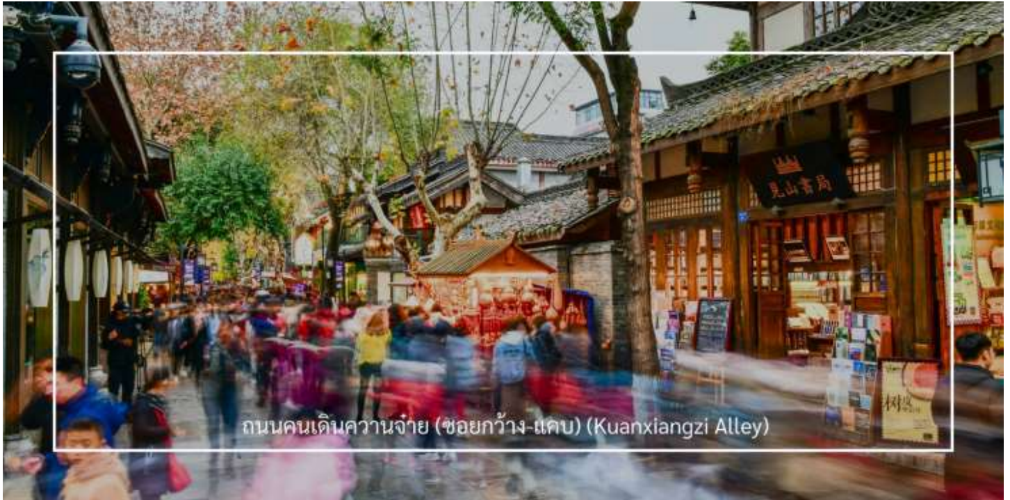
ถนนคนเดินความจ๋าย (ชอยกว้าง-แคบ) (Kuanxiangzi Alley)

เที่ยวชม ถนนคนเดินความจ๋าย (ชอยกว้าง-แคบ) (Kuanxiangzi Alley) ถนนโบราณหรือในชื่อภาษาไทยจะถูกแปลออกมาว่า "ถนนชอยกว้างชอยแคบ" โดยมีนัยว่า หากถนนมีความกว้างนั้นหมายถึงพื้นที่สำหรับคนชนชั้นสูง หรือคนมีฐานะ เพราะคนสมัยนั้นโดยสารกันด้วยรถม้านั่นเอง แต่หากเป็นชอยแคบๆ ก็จะเป็นที่พักอาศัยของคนที่มีฐานะปานกลาง ก่อนจะมีการบูรณะให้กลายเป็นแหล่งท่องเที่ยว ถนนคนเดินความจ๋ายเป็นสถานที่ที่มีความคึกคักและมีชีวิตชีวา โดยเฉพาะในช่วงเย็น ที่ผู้คนมักออกมาเดินเล่นและสนุกกับกิจกรรมต่างๆ ถนนนี้เต็มไปด้วยร้านค้า ร้านอาหาร และร้านขายของที่ระลึก นักท่องเที่ยวสามารถเลือกซื้อสินค้าท้องถิ่น เช่น งานหัตถกรรม เสื้อผ้า และของฝากต่างๆ รวมถึงอาหารท้องถิ่นที่อร่อย