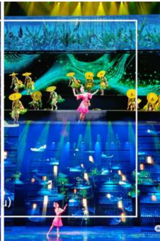
การแสดงโชว์ซีลิ่งคาปู (Xilan Kapu)

เดินทางเข้าโรงแรมที่พัก Xiazhou Hotel ระดับ 4 ดาวหรือเทียบเท่า