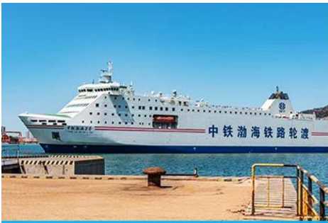
เรือ ZHONGTIE BOHAI CRUISE