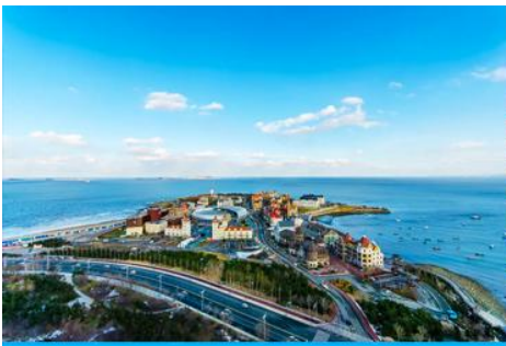
ท่าเรือชาวประมงไห่ซาง