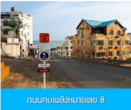
ถนนคอบเพลิงหมายเลข 8

นำท่านชม สวนสาธารณะเวย์ไห่ 威海公园 สวนสาธารณะริมทะเลที่ใหญ่ที่สุดของเมืองเวย์ไห่ ให้ท่านชมและถ่ายภาพคู่กับ กรอบรูปยักษ์วิวทะเล 威海公园大相框 แลนด์มาร์คที่เป็นอีกหนึ่งไฮไลท์ที่สุดฮิตของเวย์ไห่