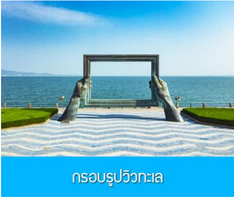
กรอบรูปวิวทะเล