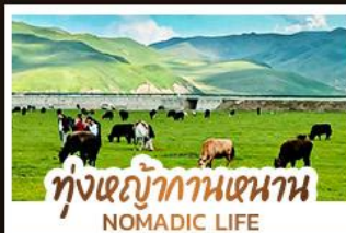
ทุ่งหญ้ากานหนาน NOMADIC LIFE