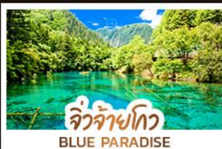
จิวจ้ายโกว BLUE PARADISE