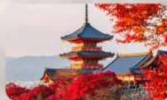
วัดคิโยมิชิ