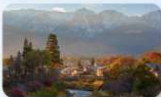
โออิเตะ ปาร์ค