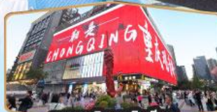
ถนนคนเดินถวณอันเฉียว