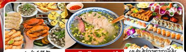
บุฟเฟ่ต์ซีฟู้ด | เมนูจีนเรียงจาน (บุ๊ฟ) | บุฟเฟ่ต์อาหารญี่ปุ่น Bababa Japanese Restaurant