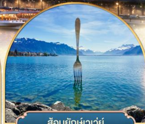
ล้อมยึกเขาวัว