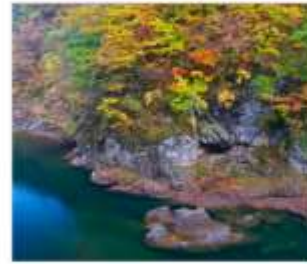
ชุนเขาดากิไคริ