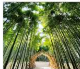
ป่าไฟวากายามะ