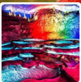
กำแพงเทพ