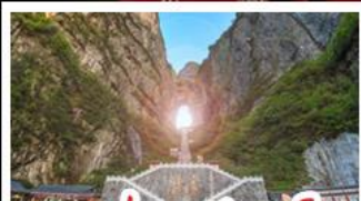
เขาประตูลั่วจื่อ