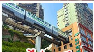
รถไฟทะลุคด