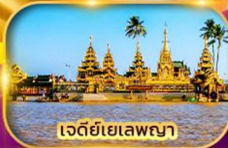
เจดีย์เยเลพญา