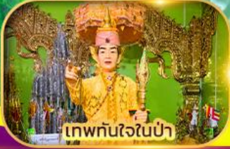
เทพทันใจในป่า