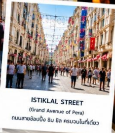
ISTIKLAL STREET (Grand Avenue of Pera) ถนนสายช้อปปิ้ง ยืน อิล ครอบคลุมพื้นที่นี้