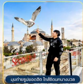
มุขถ่ายรูปรออดิต ใกล้เคียงนางนวล