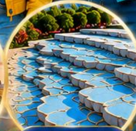
ปามุกคาล์ Pamukkale