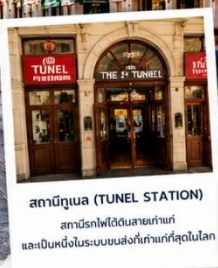
สถานีทูนเนล (TUNEL STATION) สถานีรถไฟใต้ดินสายเก่าแก่ และเป็นหนึ่งในระบบขนส่งที่เก่าแก่ที่สุดในโลก