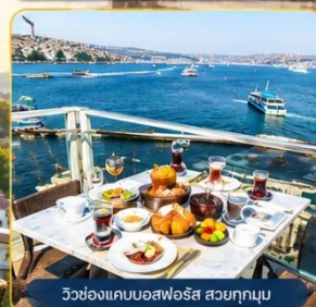
วิวช่องแคบบอสฟอรัส สวยทุกมุม