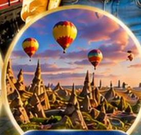
เมืองคปปาโดเกีย Cappadocia