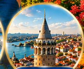
หอคอยกาลาตา Galata Tower