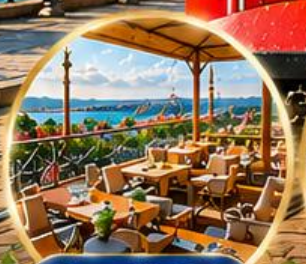
Seven Hills Cafe ชมวิว อิสตันบูล