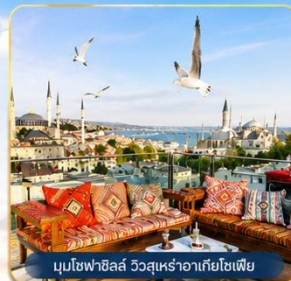
มุขโหลบฮิลล์ วิวสุเหร่าฮาเกียโซเฟีย

ช่องแคบบอสฟอรัส • สุเหร่าสีน้ำเงิน • สุเหร่าฮาเกียโซเฟีย