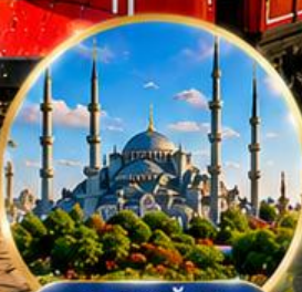
สุเหร่าสีน้ำเงิน Blue Mosque