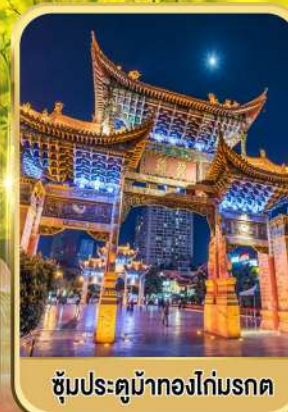
ซุ้มประตูม้าทองไถ่มรดก