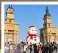
ตุ๊กตาคีบะยักษ์