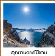
อุทยานดางโป่ซาน