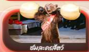
หมีละครีตซ์

09-16 ต.ค.69 / 15-22 ต.ค.69 / 22-29 ต.ค.69