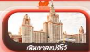
เทินเวาสเปร์ริว