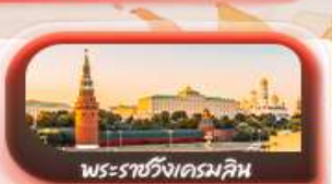
พระราชวังเครมลิน