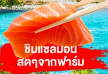
ชิมแซลมอน สดๆจากฟาร์ม