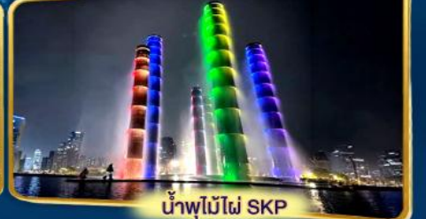
น้ำพุไม้ไฟ SKP