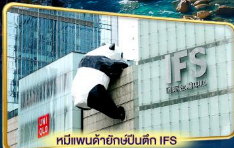
หมีแพนด้ายักษ์ปีนตึก IFS