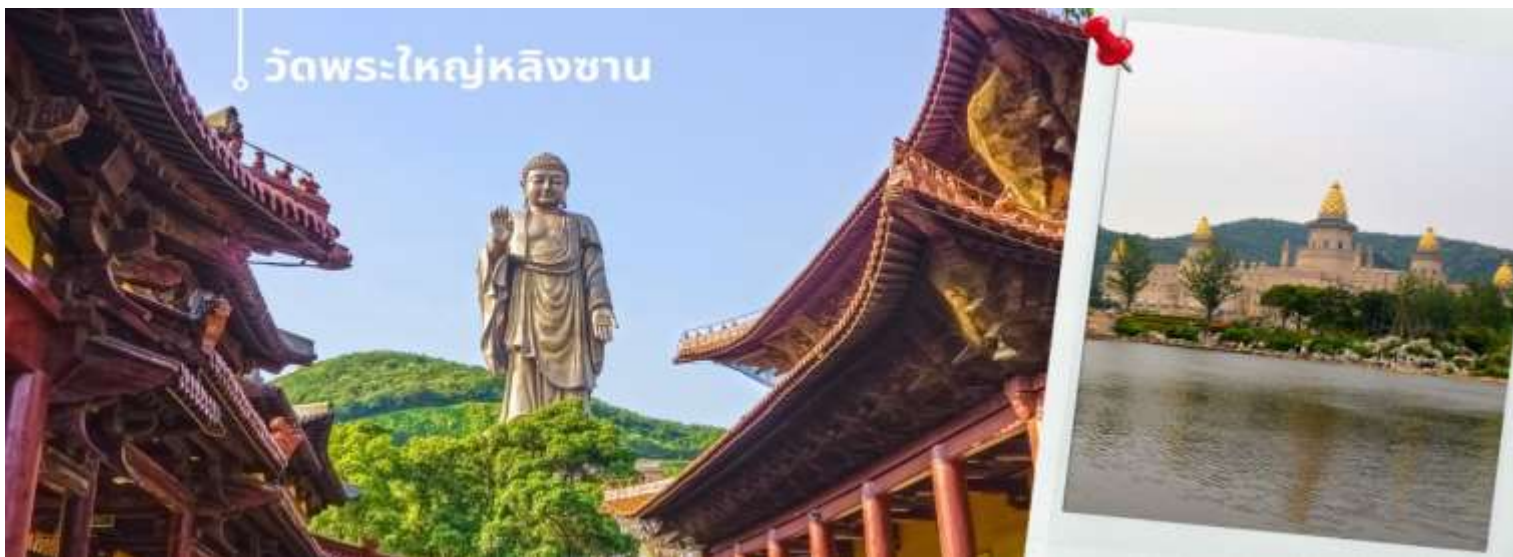
วัดพระใหญ่หลิงซ่าน

พักที่ (เมืองอู๋ซี) Holiday Inn Express Wuxi Hotel หรือเทียบเท่า ระดับ 4 ดาว