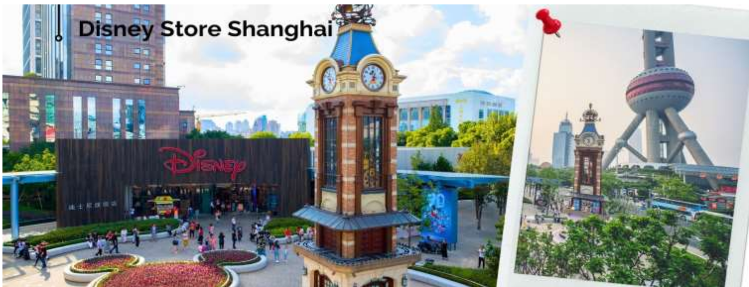
Disney Store Shanghai

นำท่านเดินทางกลับสู่มหานครเซี่ยงไฮ้ โดยใช้เวลาเดินทางประมาณ 2 ชั่วโมง จากนั้นนำท่านแวะชมความอลังการของ Disney Store Shanghai สาขาที่ใหญ่ที่สุดในโลก ให้เหล่าสาวก Disney ที่เพลิตเพลิน และเลือกซื้อสินค้าทุกคาแรกเตอร์ของ Disney จากนั้น ผ่านชมหอไข่มุก เป็นหอส่งสัญญาณวิทยุโทรทัศน์สูง 468 เมตร ลักษณะเป็นไข่มุก 11 ลูก และ เสา 3 เสา ด้านบนเป็นรูปไข่มุก 3 เม็ด 3 ขนาดเรียงกันในแนวตั้ง เมื่อชมวิว ถ่ายรูปกันจนหน้าใจแล้ว