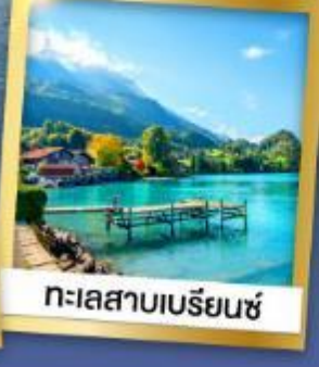
ทะเลสาบเบิร์น