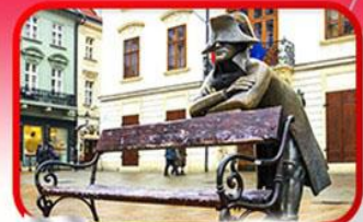
ย่านเมืองเก่าปราทิสสลา

เที่ยวเมืองสวยริมทะเลสาบ ฮัลล์สตัดท์ • ชมเมืองไข่มุกแห่งโบฮีเมีย เซสกี กรุงลอน • ปราก • เวียนนา • ซอปปิงพาร์นดอร์ฟ เอาก์เล็ท