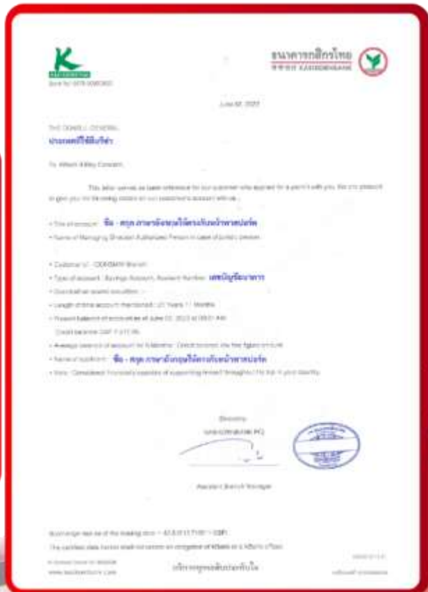
ตัวอย่าง Bank Guarantee ที่ผู้สมัครต้องยื่นกับธนาคาร