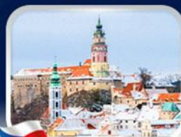
เมืองเซสกี คุลมลอฟ