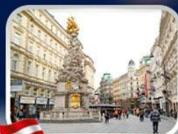
ช้อปปิ้งคาร์ทเนอร์สตรีก