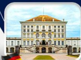
พระราชวังนิมเฟนบูร์ก