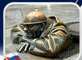
ประติมากรรม Cumil

มาเรียนพลาทซ์ • บ้านเกิดโมซาร์ท • พระราชวังฮอฟบวร์ก • ซาลส์บวร์ก • บ้านเกิดโมซาร์ท • เกรโกเดรสตรีก • ทะเลสาบคอนิกซ์ • หมู่บ้านอัลล์สตัดท์ • อนุสาวรีย์มาเรียเทเรซา