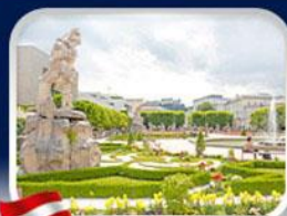
สวนมิราเบล ซาลซ์บูร์ก